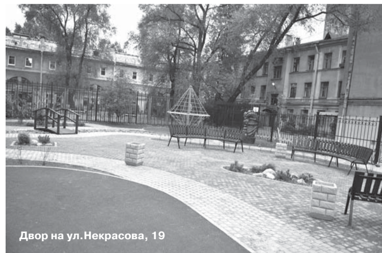
Двор на ул. Некрасова, 19