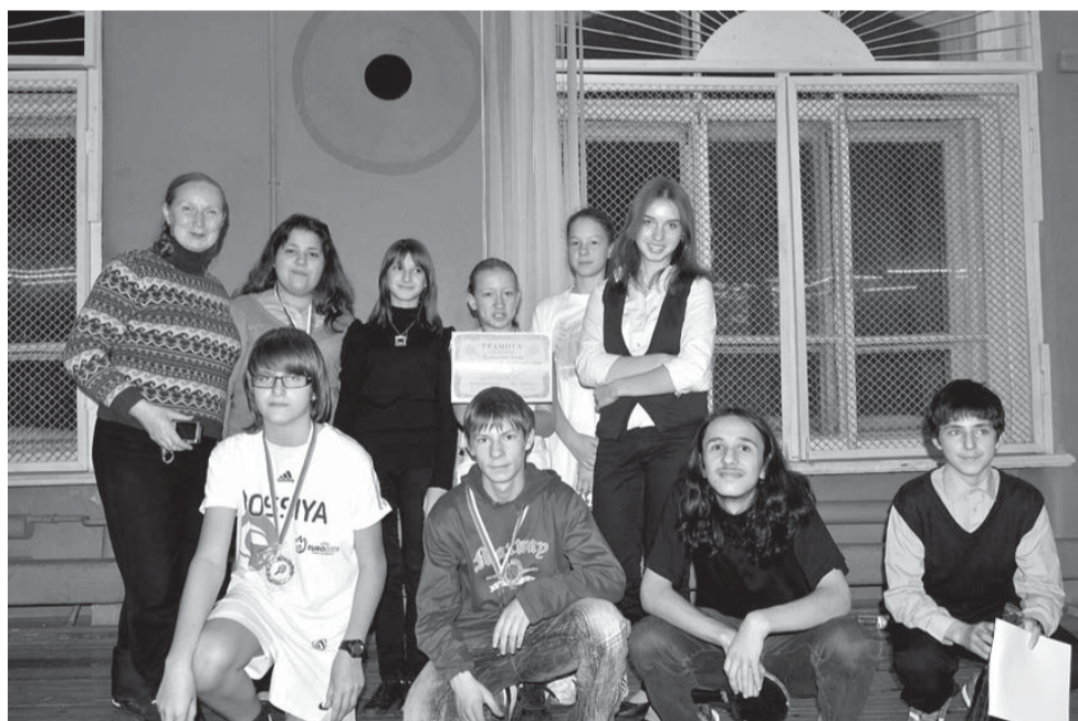
Команда Литейного округа. Старшая возрастная группа

Призеры турнира награждены медалями, грамотами и ценными призами.