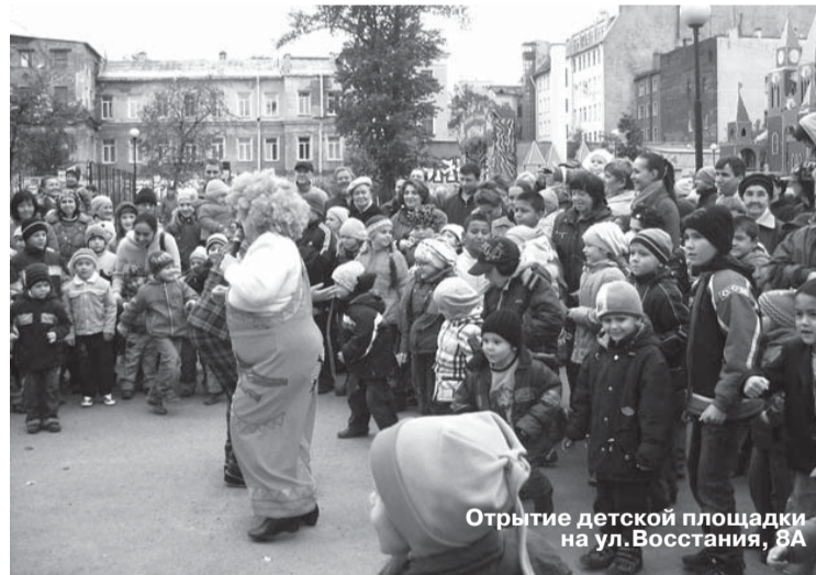
Открытие детской площадки на ул. Восстания, 8А

шагали в ногу со временем, Муниципальный Совет принял решение организовать бесплатные курсы компьютерной грамотности. В 2010 году в учебно-консультационном пункте ГОЧС №2 на Ковенском переулке, 11, который по итогам года занял I место в городском смотре-конкурсе на лучшую учебно-материальную базу гражданской обороны среди муниципальных образований, заработал компьютерный кабинет. У меня уже есть несколько благодарственных писем, которые начали приходить от Вас! Большое спасибо. Всегда приятно, когда какое-то начинание Муниципального Совета получает отклики жителей.